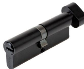
Цилиндрический механизм Avers ZM-90-C-BLM

Код товара: 35177 НОВИНКА! Цвет: BLM (чёрный)