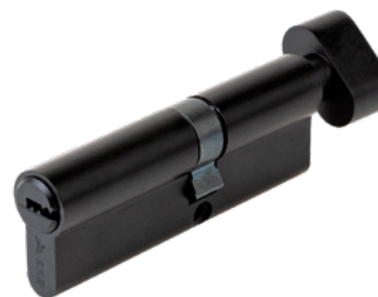
Цилиндрический механизм Avers ZM-90(40C/50)-C-BLM

Код товара: 35176 НОВИНКА! Цвет: BLM (чёрный)