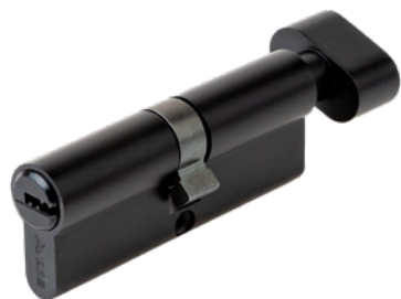
Цилиндрический механизм Avers ZM-80-C-BLM

Код товара: 35179 НОВИНКА! Цвет: BLM (чёрный)