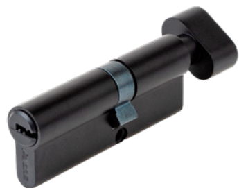
Цилиндрический механизм Avers ZM-80(35C/45)-C-BLM

Код товара: 35176 НОВИНКА! Цвет: BLM (чёрный)