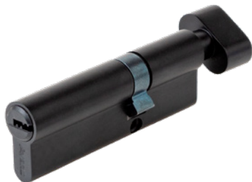
Цилиндрический механизм Avers ZM-90(35C/55)-C-BLM

Код товара: 35180 НОВИНКА! Цвет: BLM (чёрный)