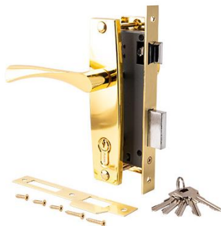
Замок врезной Avers 1323/70-G