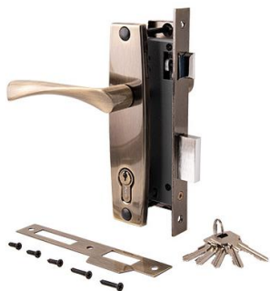
Замок врезной Avers 1323/70-AB