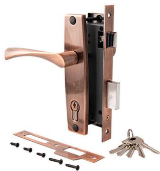
Замок врезной Avers 1323/70-AC