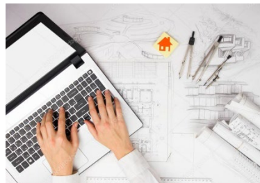
ФАЙЛЫ ДЛЯ ПРОФЕССИОНАЛОВ